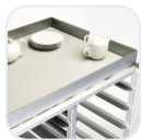
Compact panel top with 50mm edge