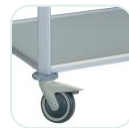
Brake on 2 swivelling wheels