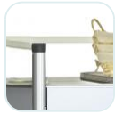
Upper railing 150mm