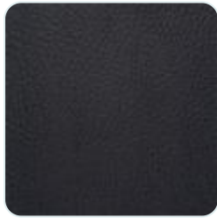
Nappa black leather