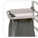
Lateral garbage bag holder