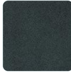
Black caviar look